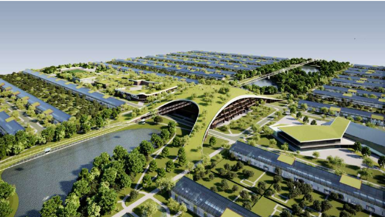
Рис. 1. Визуализация коммуникации линейного города с другими кластерами посредством ЮСТ