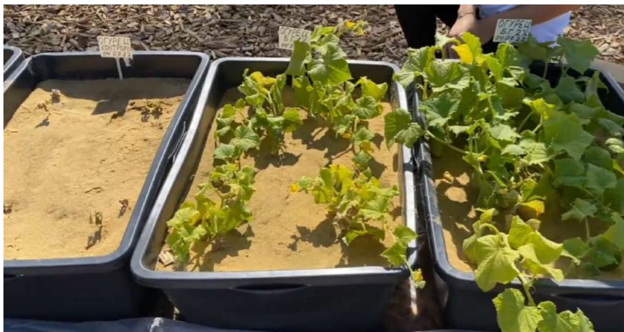
Рис. 2. Рост огурцов на песке и с содержанием гумуса 1% и 2% по массе

В ходе исследования были получены результаты эффективности роста огурцов, выращиваемых на строительном песке и при внесении живого реликтового гумуса в него в количестве 1% и 2% по массе, показанные на Рис. 2.