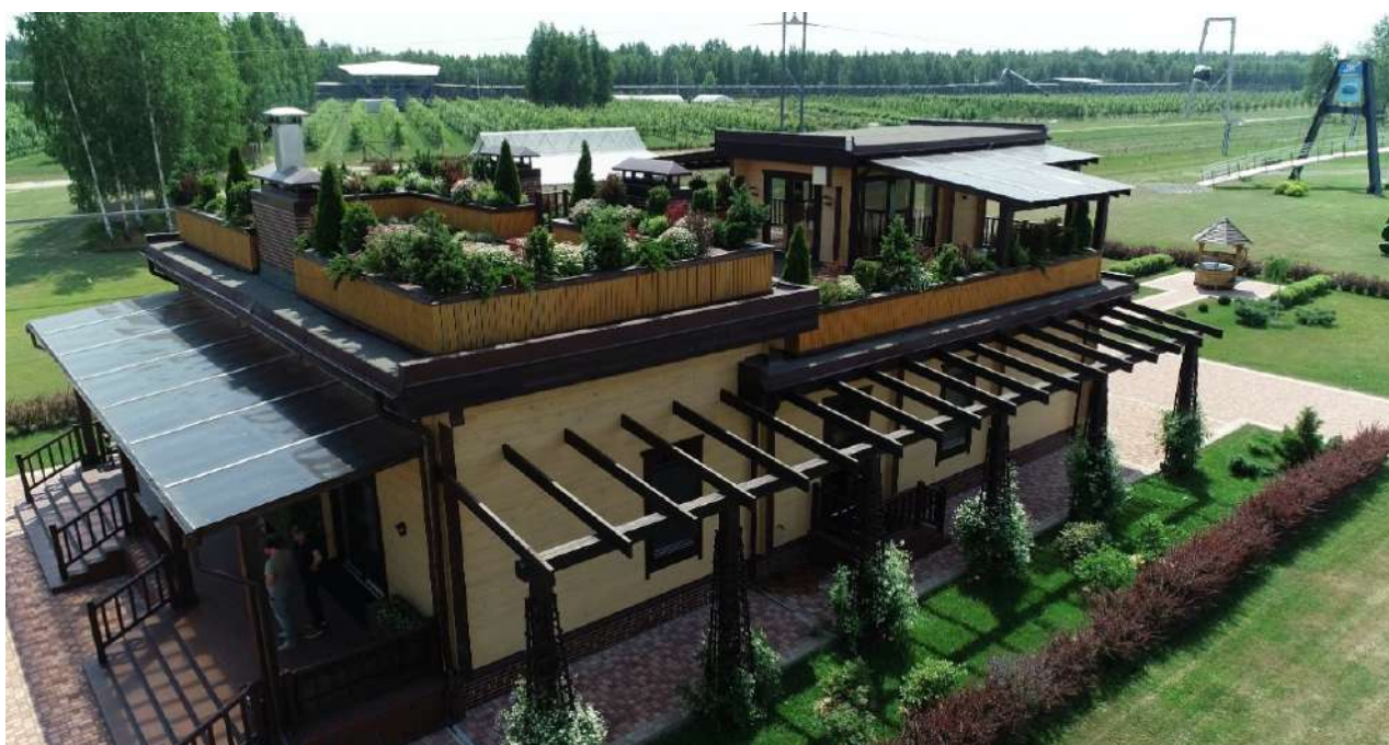
Рис. 3. Экодом, функционирующий по принципу природной экосистемы, построенный в г. Марьина Горка (Беларусь)

стьянского (фермерского) хозяйства «Юницкого») все органические отходы перерабатываются в плодородный гумус и техническую воду, обогащённую жидким гумусом. Этот эксперимент подтверждает, что отходами своей жизнедеятельности человек способен прокормить не только себя, но и ещё одного человека, причём не только не отравив Живую Природу, но и обогатив её живым плодородным гумусом.