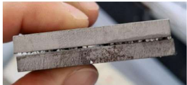
Рисунок 3 – Зазор после устранения нагрузки

При этом после снятия нагрузки зёрна карборунда полностью не внедрились и образовывался зазор, что нежелательно, и для улучшения условий соединения материалов требуется его заполнение (рисунок 3).