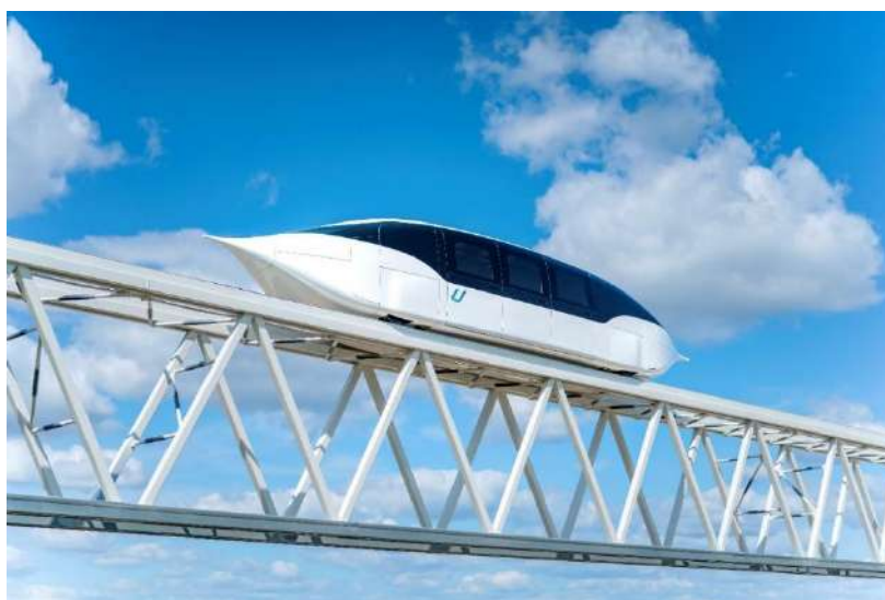
Рис. 2. Высокоскоростное транспортное средство юнифлэш U4-362, г. Марьина Горка, 2020 г.

По прогнозам развития транспорта спрос на пассажирские перевозки высокоскоростным транспортом в мире к 2050 г. увеличится почти в 3 раза [8]. Существенную нишу возникшего мирового спроса планируется восполнить инновационными ТС, в т. ч. струнным транспортом uST (Unitsky String Technologies). В нём беспилотные навесные и подвесные ТС в виде рельсовых электромобилей на стальных колёсах перемещаются за счёт электрической тяги по неразрезной предварительно напряжённой рельсо-струнной путевой структуре эстакадного типа [9, 10]. Данная технология в настоящее время воплощается белорусской компанией ЗАО «Струнные технологии» в ЭкоТехноПарке (Марьина Горка, Республика Беларусь) и в Центре тестирования и сертификации uST (Шарджа, Объединенные Арабские Эмираты). Группой компаний uST к настоящему моменту разработано несколько моделей высокоскоростных ТС для струнных трасс, одно из которых представлено на рис. 2 [11].