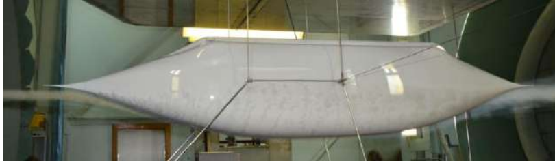
Рис. 3. Юнифлэш на продувке в аэродинамической трубе

Высокоскоростное транспортное средство струнного транспорта содержит кузов обтекаемой формы с плавно сопряженными между собой передней и задней частями. Передняя и задняя части кузова выполнены конусообразными с образующими, представленными криволинейными со знакопеременной кривизной. При этом угол между осью кузова и касательной к образующей в продольном сечении как передней, так и задней части кузова не превышает 30^\circ [12]. Это позволило существенно оптимизировать обтекание кузова набегающим воздушным потоком с минимальными значениями сопротивления, значительно снизив коэффициент аэродинамического сопротивления до 0,06 (рис. 3). Уникальная аэродинамика позволяет значительно повысить скорость ТР, снизить потребление энергии [13].