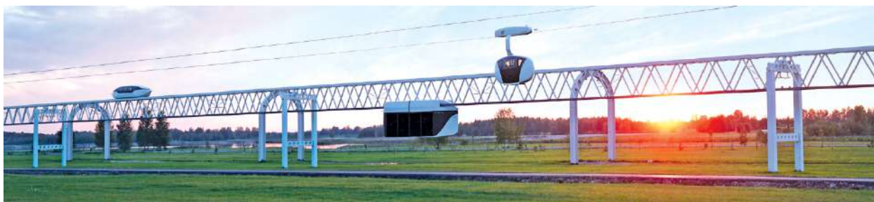
Рисунок 3 – Демонстрационно-испытательный центр «ЭкоТехноПарк» (Марьяна Горка, Беларусь), 2020 г.

Инновационные транспортно-инфраструктурные комплексы ЮСТ обладают и другими конкурентными преимуществами: низкое энергопотребление (в 2–3 раза ниже по сравнению с традиционными видами транспорта, использующими стальные колёса или магнитную подушку, и в 5–7 раз ниже по сравнению с автомобильным транспортом); сниженная себестоимость перевозок (экономия фонда оплаты труда за счёт отсутствия водителей для подвижного состава, низкие расходы на техническое обслуживание); минимальный землеотвод под строительство (0,05–0,1 га/1км трассы, что требует в 30–50 раз меньше земли, чем для строительства железнодорожных или автомобильных магистралей аналогичной производительности); длительный гарантийный срок эксплуатации до капитального ремонта (эстакады – от 50 лет, подвижного состава – от 25); оперативность и низкие затраты ресурсов для интеграции в действующую городскую и информационно-коммуникационную инфраструктуру [4, 5, 6].