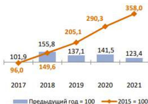
Рисунок 1 – Индекс объёма пассажирских перевозок таксомоторным транспортом

В структуре пассажирских перевозок по видам транспорта наблюдается устойчивый рост спроса на пользование таксомоторным транспортом – легковые автомобили-такси, что свидетельствует о перераспределении спроса в сторону более мобильных и комфортных видов транспорта (рисунок 1) [2].